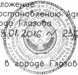
Схема расположения проезда Восточный в городе Глазго

Приложение к постановлению Администрации города Глазго от 18.01.2016 № 23/2